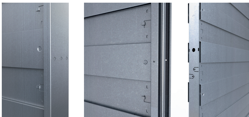
Pose facilitée avec traits de niveau à 1 m du sol fini, repères de centrage et de vissage, préperçages...